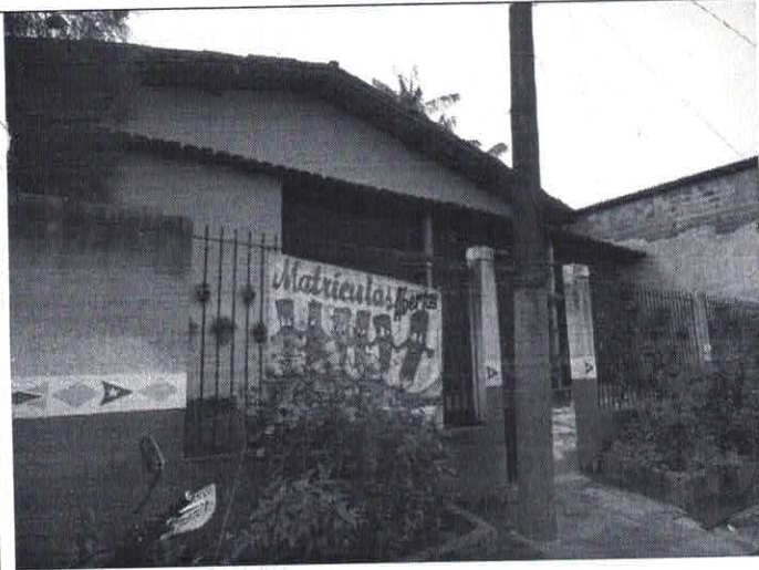
Foto 2- Vista frontal.