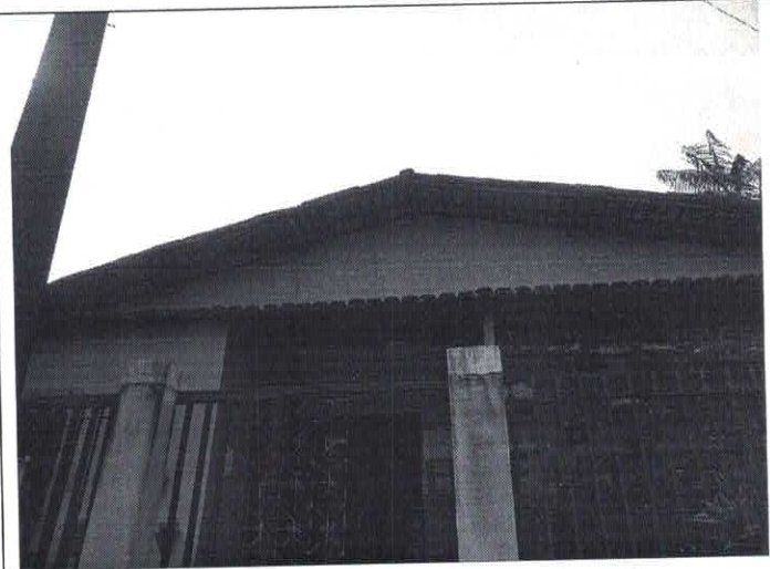
Foto 3-Vista do patio